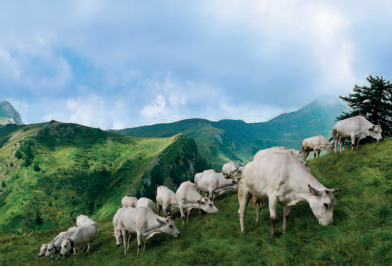
Beppino Occelli (links) gönnt seinen Tieren die herrlichsten Weideplätze in den Seealpen.