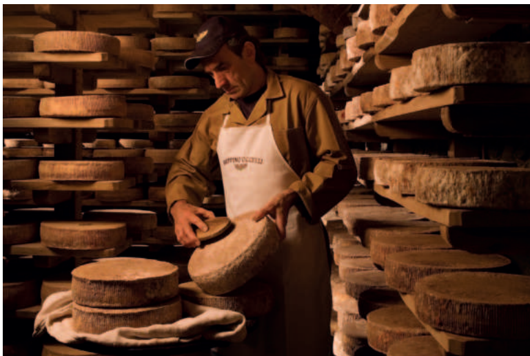
Ohne regelmäßiges Bürsten kommt der beste Käse nicht aus.